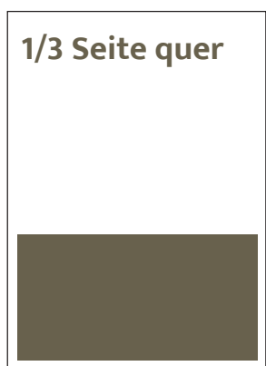
Format 180 x 85 mm SFr. 550,-