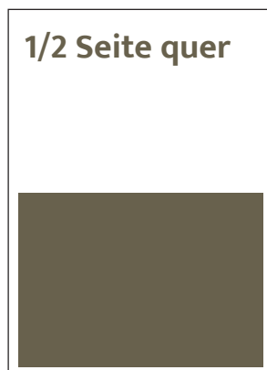
Format 180 x 130 mm SFr. 800,-