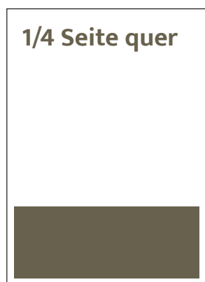
Format 180 x 62 mm SFr. 425,-