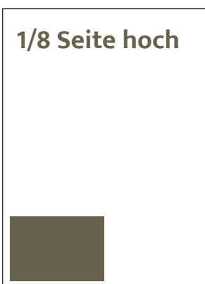
Format 87 x 62 mm SFr. 250,-