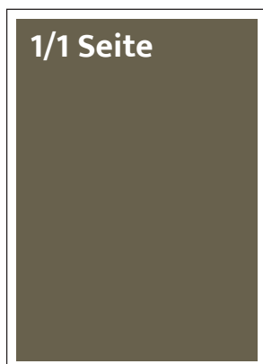
Format 180 x 265 mm SFr. 1500,-

Satzspiegel: 180 x 265 mm ; randabfallend 210 x 297 mm