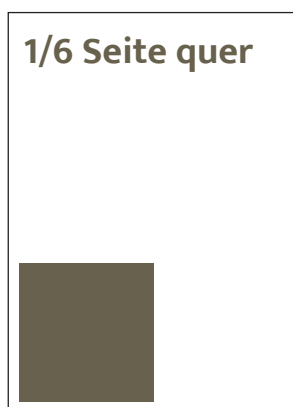
Format 87 x 85 mm SFr. 300,-